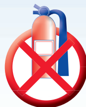
EXTINCTEUR À POUDRE