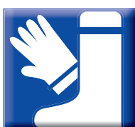
Bottes + gants

Surchaussures Masque à gaz intégral + cartouche homologuée Gants néoprène Tablier renforcé en PVC