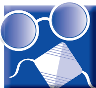
Lunettes + masque